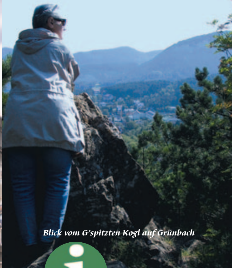
Blick vom G'spitzen Kogl auf Grünbach